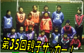
第35回親子サッカー!

メール: nakazato@avanzare-sc.com TEL: 070-5475-8514