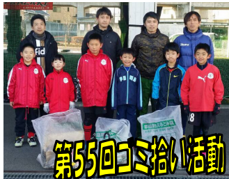
第55回ゴミ拾い活動!

2月7日にアバンツァーレ専用室内練習場でクラブイベントを実施しました。まず初めにゴミ拾い活動。286号線の通り沿いを少し行っただけで大収穫! 車に気を付けながら道路沿いを綺麗にしました。1回だけでは、全部を綺麗にするまではいきませんが、少しずつの積み重ねで綺麗にしていくことが大切! 子供たちにも伝わっていると、いいのですが、どんなことも何回も継続することが一番効果があるんですよ。次回のゴミ拾い活動の皆さんのご協力よろしくお願いします!